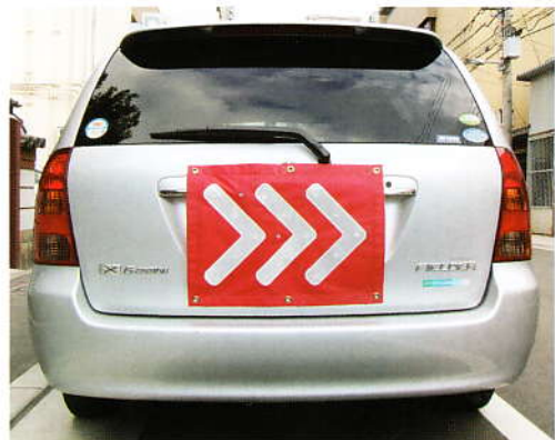
ワゴン車後部取付時